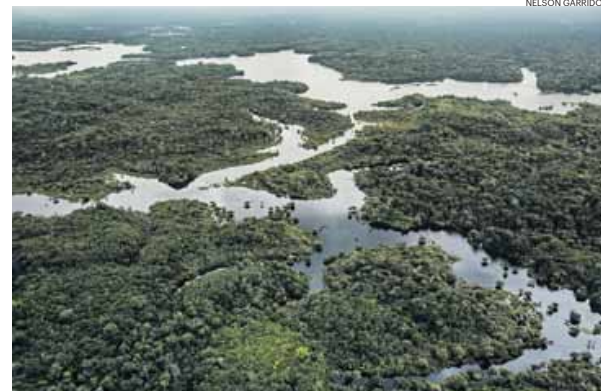
Um país que tenha uma floresta poderá ser recompensado

azul. Saiba mais sobre ambiente em publico.pt/azul