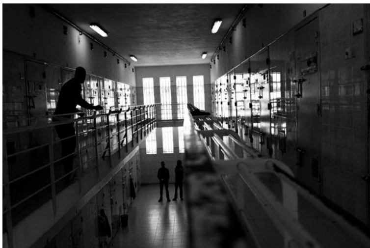
EP Leiria.

Atendendo a este pressuposto, esta conferência internacional intitulada “Sistemas penitenciários e arquitetura prisional: como estão relacionados? Uma perspectiva europeia” pretende explorar a relação que se estabelece entre a arquitetura prisional e o desenho carcerário e alguns elementos centrais inerentes ao funcionamento e vivência dos sistemas prisionais, como o processo de adaptação à prisão, as emoções experienciadas pelos reclusos ou o impacto que estes fatores exercem no cumprimento da medida e na gestão carcerária. Além disso, em vez de se centrar num contexto nacional específico, esta conferência foi concebida para promover uma análise comparativa e uma reflexão sobre a experiência de diferentes países relativamente a estes elementos.