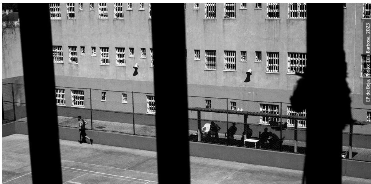
EP de Beja.